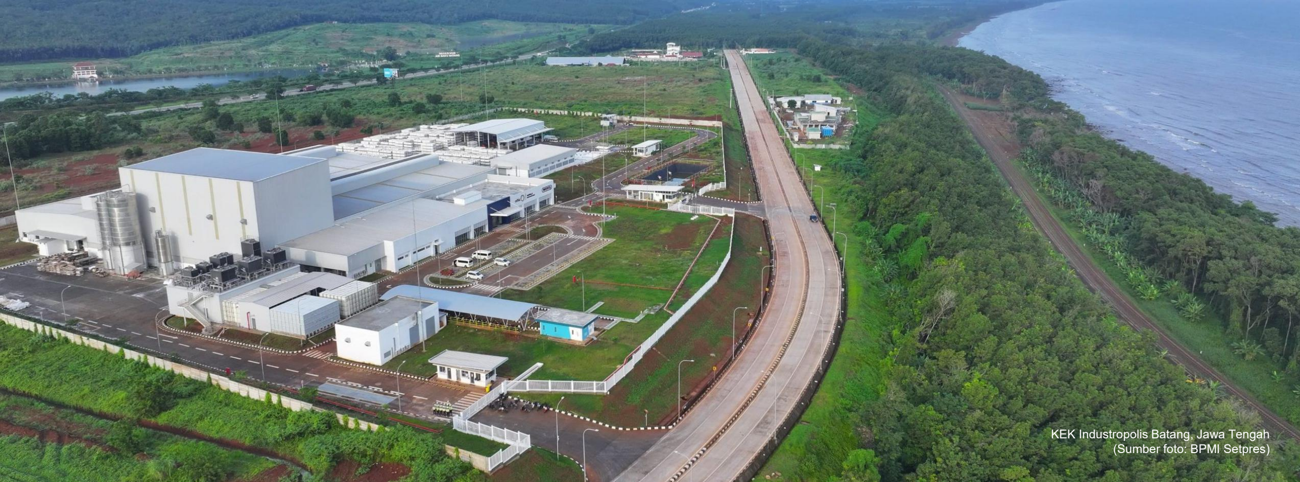
KEK Industri Batang, Jawa Tengah